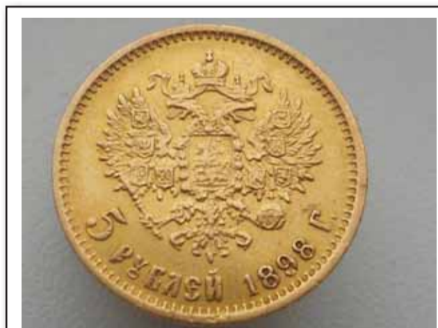
Золотой пятирублевик — самая долгожданная и желанная находка