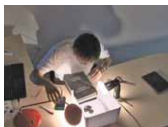
Фото на подоконнике. Как правильно фотографировать свои находки при естественном освещении — медные и серебряные монеты, большие рельефные предметы.