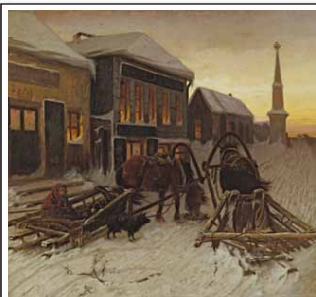
«Последний каба́к у заставы». А не с этого ли трактира, обнаруженного питерскими археологами, писал Василий Перов свою знаменитую картину?

С точки зрения чистой науки результаты раскопок во многом уникальны – в Петербурге впервые обнаружено питейное заведение, которое смогло просуществовать более полутора сотен лет. Большая удача, что в одном из горизонтов сохранились не истлевшие доски или бревна, а влажный деревянный слой. По спилам с него археологи получают так называемые дендродаты и смогут с точностью до года