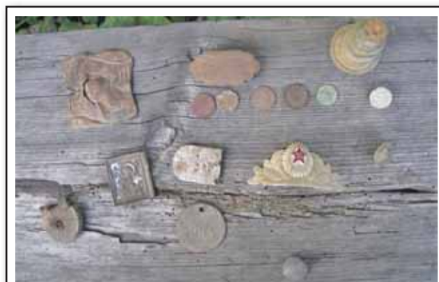
Помимо колеса от телеги на месте бывшей деревушки были найдены и другие вещи. Но клада, на который рассчитывал местный дедушка, к сожалению, не было.