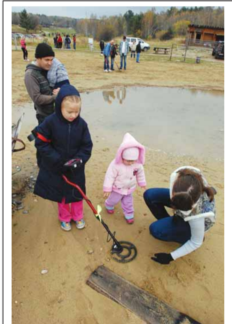
Поиск с металлодетектором давно стал семейным увлечением, одинаково доступным для всех поколений.

Я недавно получил отзыв от общественного движения "Аматор". Они меня критикуют, говорят, что законопроект Минкультуры заслуживает большего внимания. Если тот законопро-