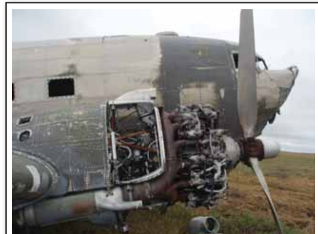
Пилотская кабина деформирована, но это вполне поправимо

Вечером 23 апреля 1947 года дежурный радист Торгашина в аэропорту Волочанка готовилась к сдаче вахты. Покончив с формальностями, в оставшееся время 19-летняя девушка любила послушать частоты, на ко-