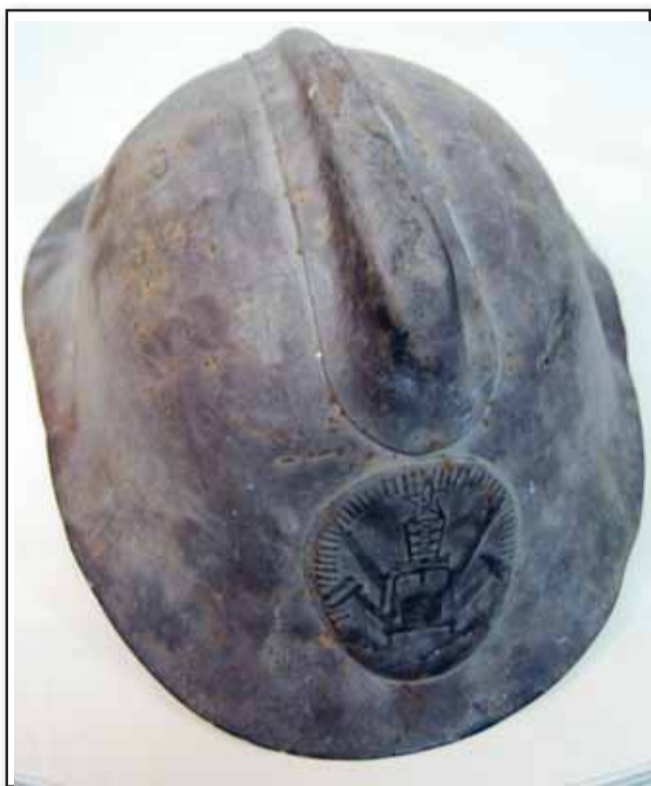
Пожарная каска советского времени «Тип М-103-61»

В день открытия музея «Кладоискатель» один из копателей подарил пожарную каску. Этот предмет является важной частью снаряжения пожарных и включает в себя часть нашего советского исторического прошлого. Пожарная каска традиционно защищала голову от ударов, поэтому неудивительно, что она по форме напоминает военный шлем. Сохранность у музейной каски удовлетворительная, но от времени и неправильного хранения она