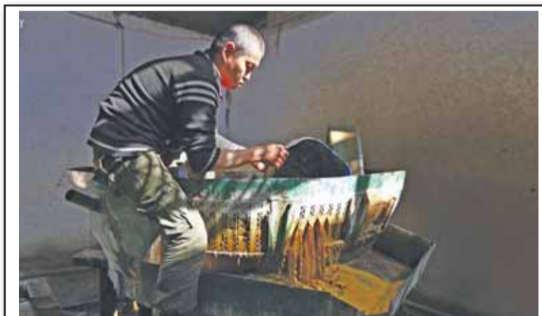
Шахтер заливает воду в камнедробилку.

Кустарная добыча в основном очень примитивна. Люди, которые ею занимаются, не знают основных принципов золотодобывающей науки, они просто выучили последовательность шагов, позволяющих извлекать золото из песка или породы. Таким образом, весь процесс кажется им какой-то магией. Большинство кустарных старателей имеют свои суеверия, возникающие на этой почве. Я видел видео, на котором постороннего человека не пускали в одну из кустарных шахт, пока он не снимет обувь, — местные рабочие думали, что это может принести неудачи.