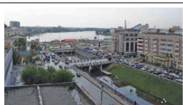
А так оно выглядит сейчас. На фото хорошо видно вытянутую форму озера и протоку, соединяющую разные его части.