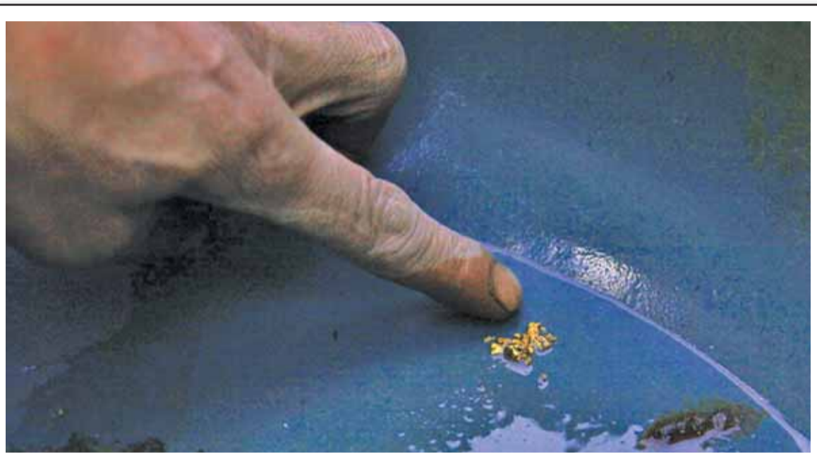
Крупница золота на дне миски

Обработка золотосодержащего материала такая же примитивная. Аллювиальные пески