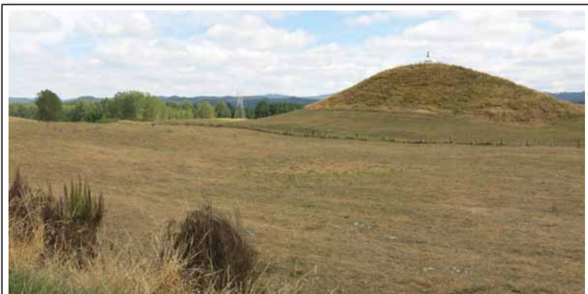
Увидев такое в России, я голову отдал бы на отсечение, что это курганы, а те, что побольше, непременно знатного хана, уж больно они ровные, как насыпанные.