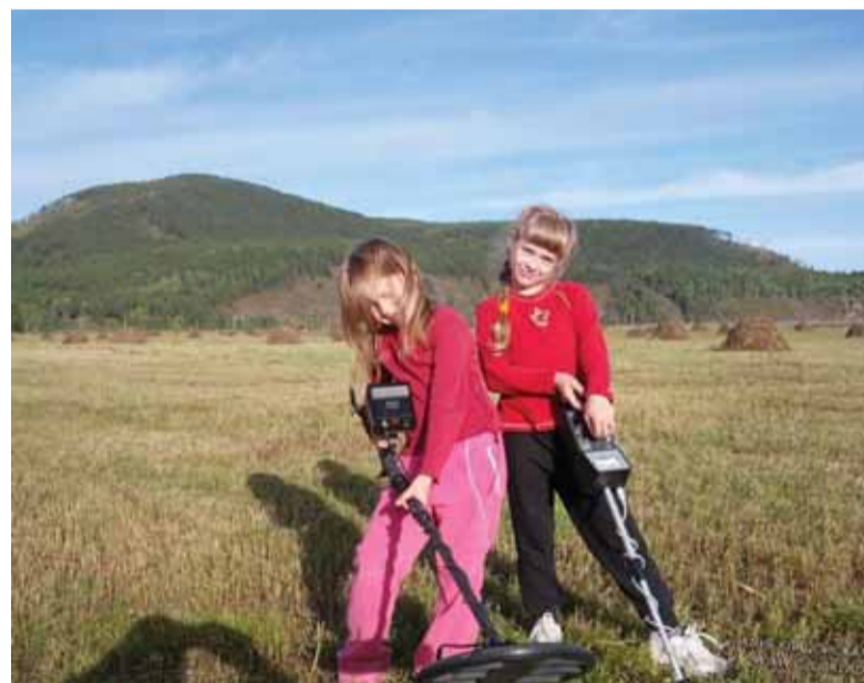
Две копуши Hort (hort20), Иркутск, clubklad.ru